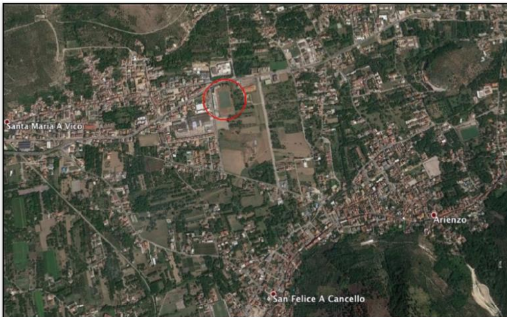
Figura 2: Aerofoto impianto sportivo

Le aree di intervento ricoprono una superficie di circa mq 25.600. Il suolo risulta già destinato ad ospitare il Campo Sportivo Comunale. In particolare, la zona ad Est è impegnata totalmente dagli spazi per le attività sportive (campo di calcio, pista di atletica e spazi annessi, campo polivalente, etc.) e la zona ad Ovest è impegnata dagli spazi di supporto alle attività sportive (tribuna, spogliatoi e locali di deposito) oltre che dal campo di calcetto. L'accesso al complesso sportivo avviene sul lato Ovest, da Via Campo sportivo.