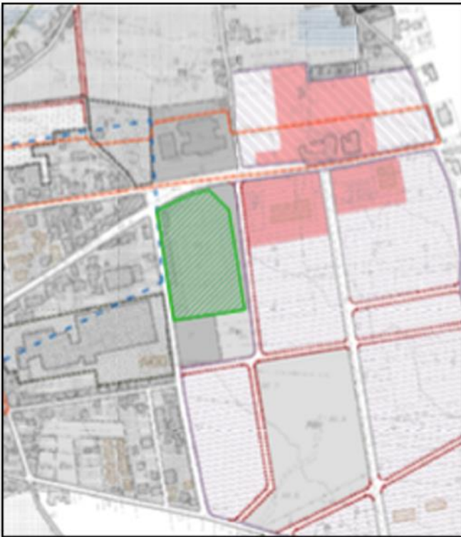
Figura 1: Stralcio PUC

Dal punto di vista urbanistico, secondo il Piano Urbanistico Comunale vigente, le aree di intervento ricadono in Zona "Verde Attrezzato e Sportivo – V5 CAMPO SPORTIVO", destinazione che risulta compatibile con la realizzazione delle opere previste in progetto.